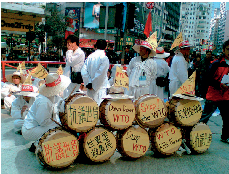
Корейские фермеры протестуют против ВТО

Позиция Китая по вопросам услуг в двух продолжающихся переговорных процессах – расширение Соглашения ВТО по информационным технологиям (ИТА) и вступление в Соглашение ВТО о правительственных закупках – подверглась публичному осуждению со стороны правительства США и деловых кругов по причине ее неадекватности. Тем