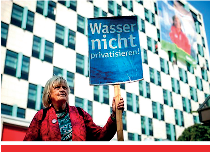
Кампания государственных муниципальных служб водоснабжения, Германия

Неолиберальный поворот во многих странах во время 1980-х и 1990-х годов привел к широкой приватизации важных общественных услуг. Борющиеся с трудностями муниципалитеты, например, прельстились на обещанные сбережения в случае приватизации энергетического хозяйства, проезда, переработки отходов, здравоохранения и других сфер государственных обязательств. Совсем недавно, однако, негативный опыт с нацеленными на прибыль моделями по предоставлению услуг, заставил многие местные власти пересмотреть приватизационные подходы. 37