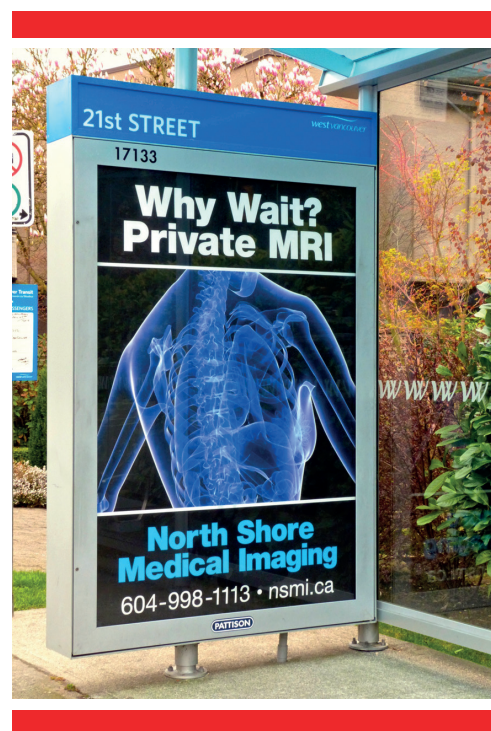
Договоры о торговле способствуют приватизации государственных услуг в здравоохранении

Неожиданный энтузиазм правительства Китая по переговорам о либерализации услуг может вполне усилить давление на TISA с ее ограничениями политической гибкости в отношении общественных услуг и регулирования общественных интересов, в особенности в приоритетных секторах, таких как здравоохранение и образование. 6