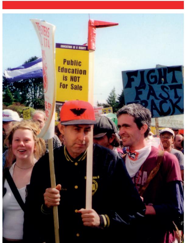
Митинг в защиту общественных услуг, Канада

Соглашения, содействующие международной торговле, должны полностью сохранять возможность правительств стран восстанавливать, перестраивать и расширять общественные услуги. По многим параметрам соглашение TISA не проходит эту важную проверку. Фактически, сам характер соглашения TISA, а именно крайняя секретность, агрессивность, гипер-либерализация и излишнее влияние корпораций, противоречит ценностям общественных услуг. Серьезные проблемы с обеспечением защиты общественных услуг в рамках соглашения ГАТС и других договоров будут только усугубляться в ходе переговоров по соглашению TISA. Излишнее обобщение соглашения TISA означает, что оно представляет угрозу для крайне важных общественных интересов, включая право на неприкосновенность частной жизни, свободу сети Интернет, нормы по охране окружающей среды и защите прав потребителей. Крайне важно, чтобы объединения общественного сектора незамедлительно начали сотрудничество