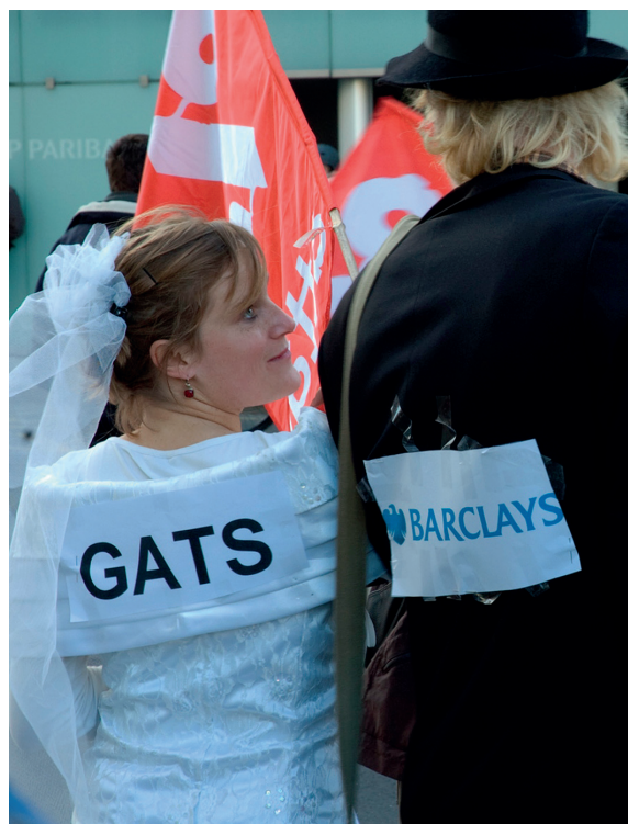
Протест против влияния банков на торговые соглашения, Франция

Высока вероятность того, что в соглашении TISA будут содержаться ограничения к