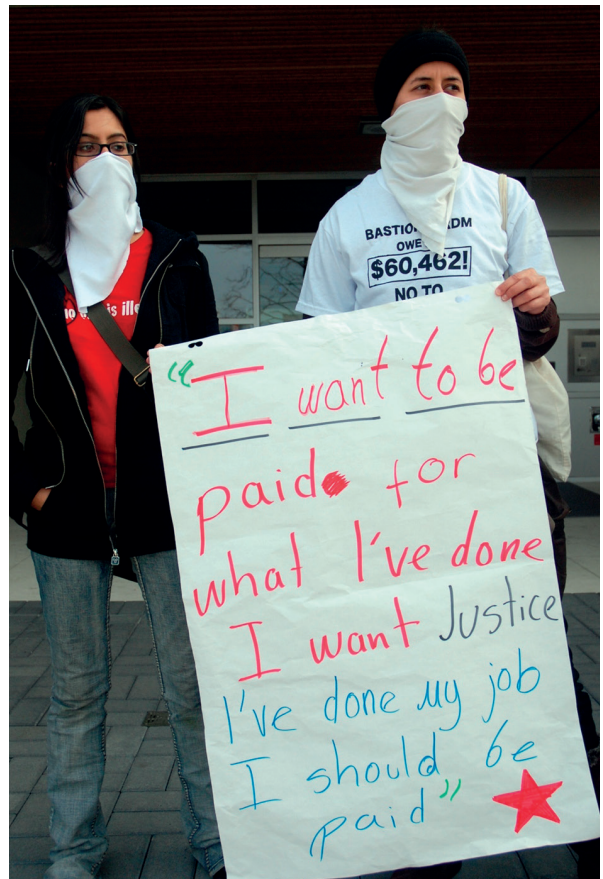
Работники-мигранты будут лишены прав в рамках соглашения TISA

Это еще один болезненный вопрос для США, оказывавших сопротивление включению дополнительных обязательств четвертого типа во время раунда переговоров по сфере услуг в Дохе. Тем не менее, расширение четвертого типа крайне важно для американских корпораций в сфере услуг. Ситуацию комментирует бывший высокопоставленный